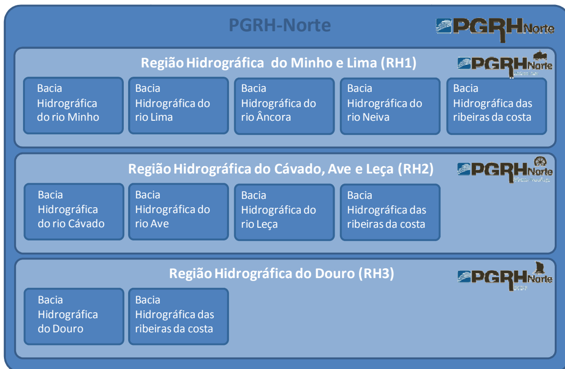
Figura 1.4.2 – Organização estruturante do PGRH-Norte

O PGRH-Norte é constituído por três tomos, o PGRH-Minho e Lima, o PGRH-Cávado, Ave e Leça e o PGRH-Douro, ou seja, um por região hidrográfica. A constituição de cada uma das regiões hidrográficas, de acordo com o Decreto-Lei n.º 347/2007, de 19 de Outubro, tal como a organização estruturante do PGRH-Norte, encontra-se esquematizada na Figura 1.4.2.