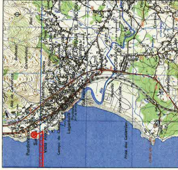
PLANTA DE LOCALIZAÇÃO ESCALA 1:25 000 EXTRACTO DA CARTA MILITAR Nº 27