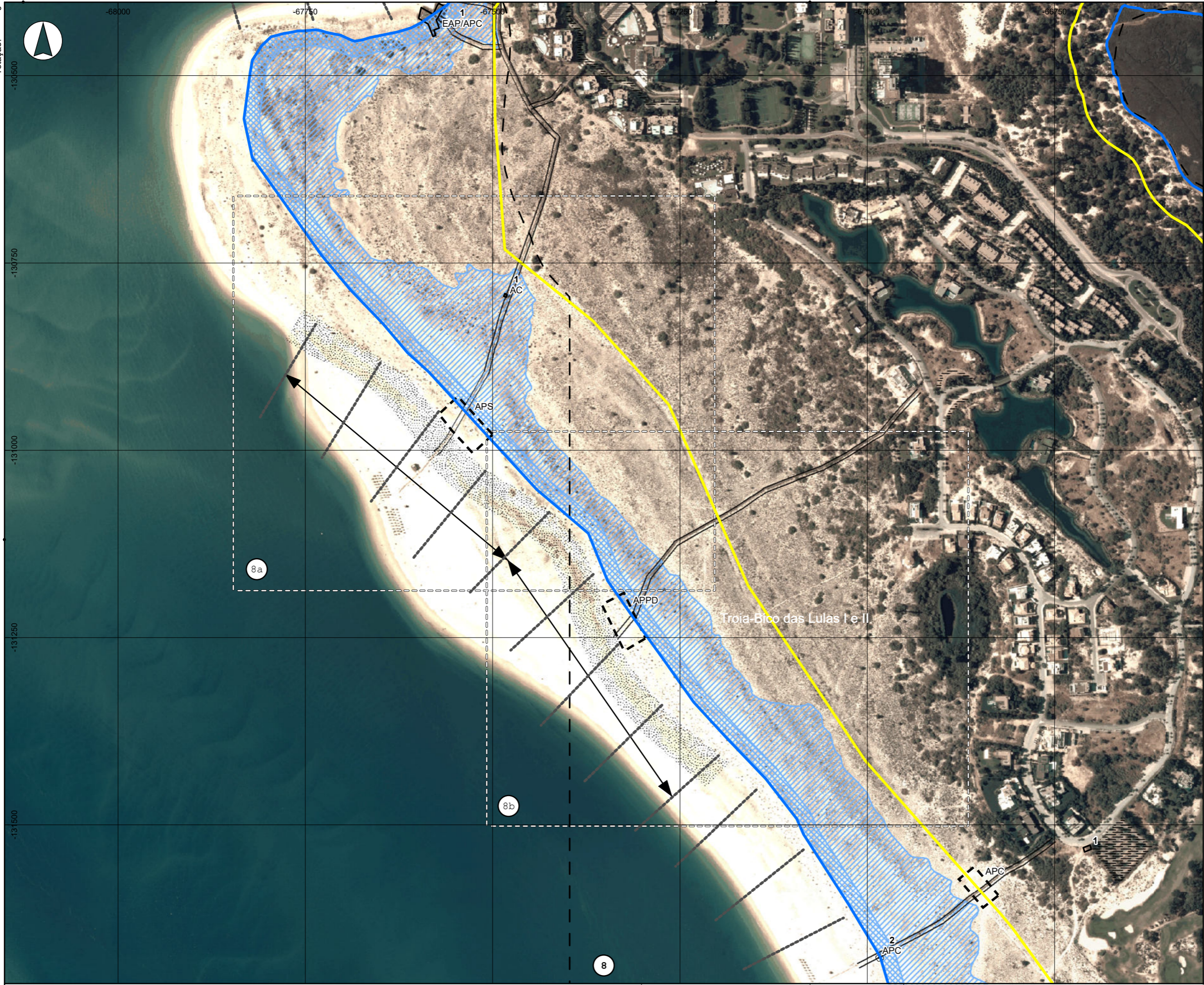
Imagem de base: Ortofotos 25 cm - Portugal Continental - 2018. PT-TM06ETRS89 - European Terrestrial Reference System 1989