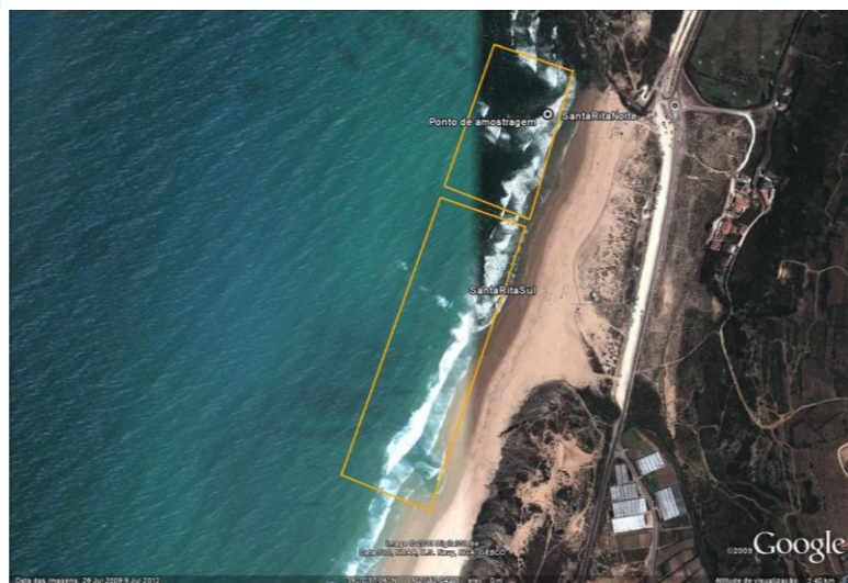
Figura 1 - Água balnear e ponto de amostragem (LAT 39.171448º, LONG - 9.360109º, ETRS89) Figure 1 - Bathing water and sampling point (LAT 39.171448º, LONG -9.360109º, ETRS89)