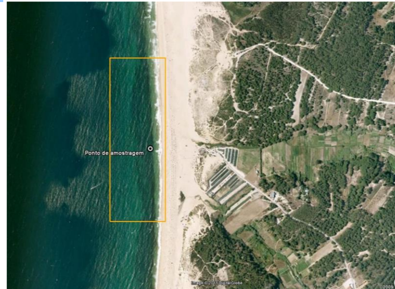
Figura 1 - Água balnear e ponto de amostragem (LAT 38.489692º, LONG -9.184583º, ETRS89) Figure 1 - Bathing water and sampling point (LAT 38.489692º, LONG -9.184583º, ETRS89)

Concelho: Sesimbra Código Água Balnear: PTCN7E Bacia Hidrográfica: Rio Tejo Massa de água: CWB-I-4 ÉPOCA BALNEAR 2021: 10 Junho a 12 Setembro Frequência de amostragem: Cada 3 semanas