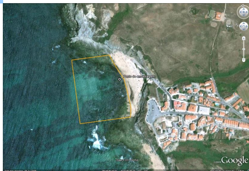
Figura 1 - Água balnear e ponto de amostragem (LAT 39.311252º, LON -9.346897º, ETRS89) Figure 1 - Bathing water and sampling point (LAT 39.311252º, LONG -9.346897º, ETRS89)

Concelho: Peniche Código Água Balnear: PTCF8D Bacia Hidrográfica: Ribeiras do Oeste Massa de água: CWB-II-4 ÉPOCA BALNEAR 2021: 12 Junho a 12 Setembro Frequência de amostragem: Cada 3 semanas