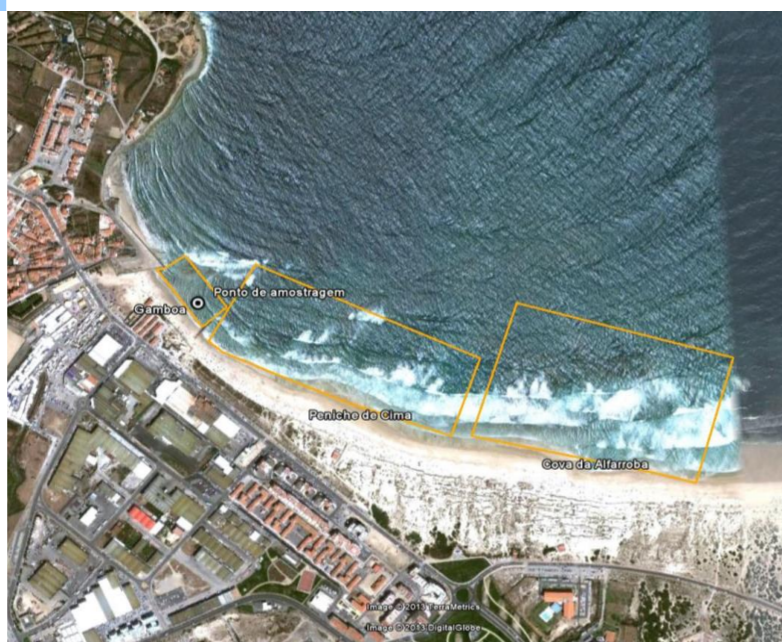
Figura 1 - Água balnear e ponto de amostragem (LAT 39.362283º, LON -9.36835º, ETRS89)

De acordo com o nº6 do Artº7º do D.L. 135/2009, republicado pelo D.L.113/2012, as águas balneares de Cova da Alfarroba, Gamboa e Peniche de Cima foram agrupadas, (PTCT9LG) sendo Gamboa o ponto de amostragem representativo do agrupamento.