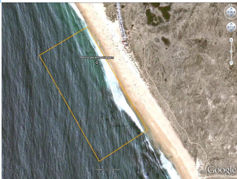
Figura 1 - Água balnear e ponto de amostragem (LAT 39.345355º, LON -9.364405º, ETRS89) Figure 1 - Bathing water and sampling point (LAT 39.345355º, LONG -9.364405º, ETRS89)