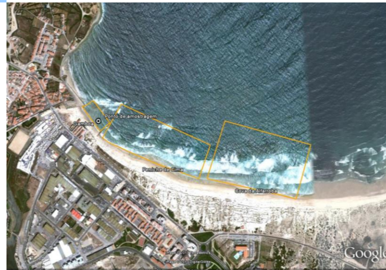
Figura 1 - Água balnear e ponto de amostragem (LAT 39.36465º, LON -9.372467º, ETRS89) Figure 1 - Bathing water and sampling point (LAT 39.36465º, LONG -9.372467º, ETRS89)

De acordo com o nº6 do Artº7º do D.L. 135/2009, republicado pelo D.L.113/2012, as águas balneares de Cova da Alfarroba, Gamboa e Peniche de Cima foram agrupadas, (PTCT9LG) sendo Gamboa o ponto de amostragem representativo do agrupamento.