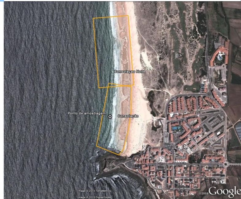
Figura 1 - Água balnear e ponto de amostragem (LAT 39.329336º, LON -9.359467º, ETRS89) Figure 1 - Bathing water and sampling point (LAT 39.329336º, LONG -9.359467º, ETRS89)

Concelho: Peniche Código Água Balnear: PTCW2D Bacia Hidrográfica: Ribeiras do Oeste Massa de água: CWB-II-4 ÉPOCA BALNEAR 2021: 12 Junho a 12 Setembro Frequência de amostragem: Cada 3 semanas De acordo com o nº6 do Artº7º do D.L. 135/2009, republicado pelo D.L.113/2012, as águas balneares de Consolação e Consolação Norte foram agrupadas, (PTCW7VG) sendo Consolação o ponto de amostragem representativo do agrupamento.