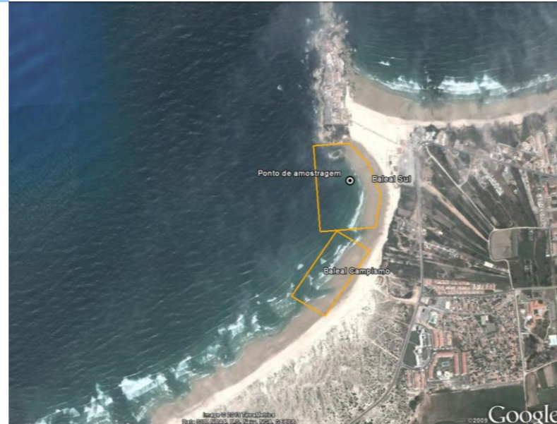
Figura 1 - Água balnear e ponto de amostragem (LAT 39.3714º, LON -9.339017º, ETRS89) Figure 1 - Bathing water and sampling point (LAT 39.3714º, LONG -9.339017º, ETRS89)

De acordo com o nº6 do Artº7º do D.L. 135/2009, republicado pelo D.L.113/2012, as águas balneares de Baleal Campismo e Baleal Sul foram agrupadas, (PTCV7PG) sendo Baleal Sul o ponto de amostragem representativo do agrupamento.