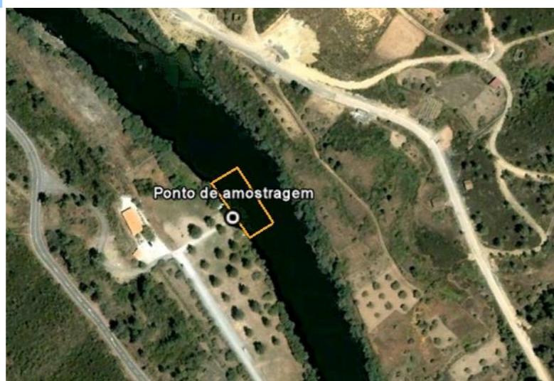
Figura 1 - Água balnear e ponto de amostragem (LAT 40.007712º, LONG -7.843284º, ETRS89) Figure 1 - Bathing water and sampling point (LAT 40.007712º, LONG -7.843284º, ETRS89)

Concelho: Oleiros Código Água Balnear: PTCP3U Bacia Hidrográfica: Bacia Hidrográfica do Rio Tejo Massa de água: Albufeira de Cabril ÉPOCA BALNEAR 2021: 1 Julho a 31 Agosto Frequência de amostragem: Quinzenal