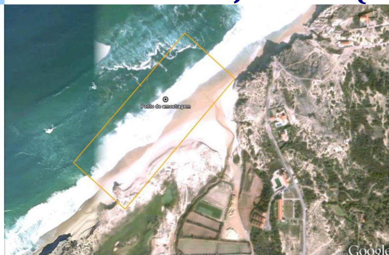
Figura 1 - Água balnear e ponto de amostragem (LAT 39.40045°, LONG -9.277617°, ETRS89) Figure 1 - Bathing water and sampling point (LAT 39.40045°, LONG -9.277617°, ETRS89)