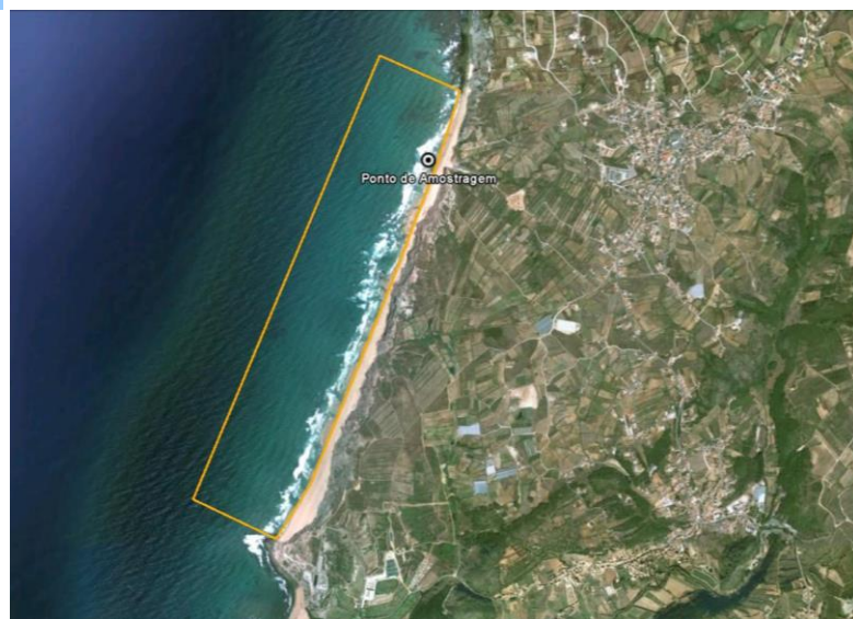
Figura 1 - Água balnear e ponto de amostragem (LAT 39.20139°, LONG -9.347519°, ETRS89) Figure 1 - Bathing water and sampling point (LAT 39.20139°, LONG -9.347519°, ETRS89)

Concelho: Lourinhã Código Água Balnear: PTCK9L Bacia Hidrográfica: Ribeiras do Oeste Massa de água: CWB-II-4 ÉPOCA BALNEAR 2021: 12 Junho a 12 Setembro Frequência de amostragem: Cada 3 semanas