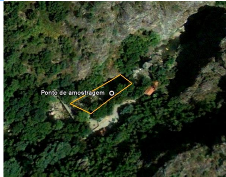
Figura 1 - Água balnear e ponto de amostragem (LAT 39.915917°, LONG -8.317019°, ETRS89) Figure 1 - Bathing water and sampling point (LAT 39.915917°, LONG -8.317019°, ETRS89)

Concelho: Figueiró dos Vinhos Código Água Balnear: PTCK7V Bacia Hidrográfica: Bacia Hidrográfica do Rio Tejo Massa de água: Ribeira de Alge ÉPOCA BALNEAR 2021: 1 Julho a 15 de Setembro Frequência de amostragem: Quinzenal