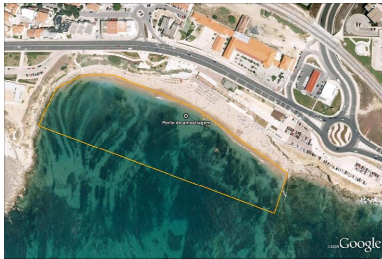
Figura 1 - Água balnear e ponto de amostragem (LAT 38.69317°, LONG -9.369004°, ETRS89) Figure 1 - Bathing water and sampling point (LAT 38.69317 °, LONG -9.369004°, ETRS89)

Concelho: Cascais Código Água Balnear: PTCH2W Bacia Hidrográfica: Ribeiras do Oeste Massa de água: CWB-I-4 ÉPOCA BALNEAR 2024: 1 Maio a 15 Outubro Frequência de amostragem: Semanal