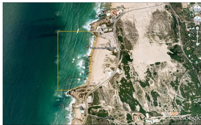
Figura 1 - Água balnear e ponto de amostragem (LAT 38.726295°, LONG-9.476987°, ETRS89) Figure 1 - Bathing water and sampling point (LAT38.726295°, LONG-9.476987°, ETRS89)

Concelho: Cascais Código Água Balnear: PTCL8D Bacia Hidrográfica: Ribeiras do Oeste Massa de água: CWB-II-4 ÉPOCA BALNEAR 2024: 1 Maio a 15 Outubro Frequência de amostragem: Semanal