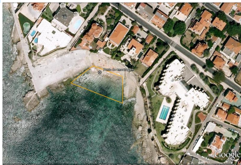
Figura 1 - Água balnear e ponto de amostragem (LAT 38.700632º, LONG -9.389408º, ETRS89) Figure 1 - Bathing water and sampling point (LAT 38.700632 º, LONG -9.389408º, ETRS89)

Concelho: Cascais Código Água Balnear: PTCJ9K Bacia Hidrográfica: Ribeiras do Oeste Massa de água: CWB-I-4 ÉPOCA BALNEAR 2024: 1 Maio a 15 Outubro Frequência de amostragem: Semanal