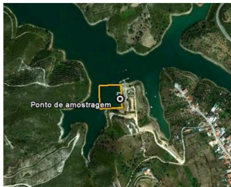
Figura 1 - Água balnear e ponto de amostragem (LAT 39.545147°, LONG -8.277665°, ETRS89) Figure 1 - Bathing water and sampling point (LAT 39.545147°, LONG -8.277665°, ETRS89)