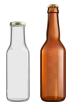
Garrafas de vidro de utilização única para bebidas

(8) Os Estados-Membros devem envidar esforços para criar e manter o sistema, dando especial atenção à inclusão de: