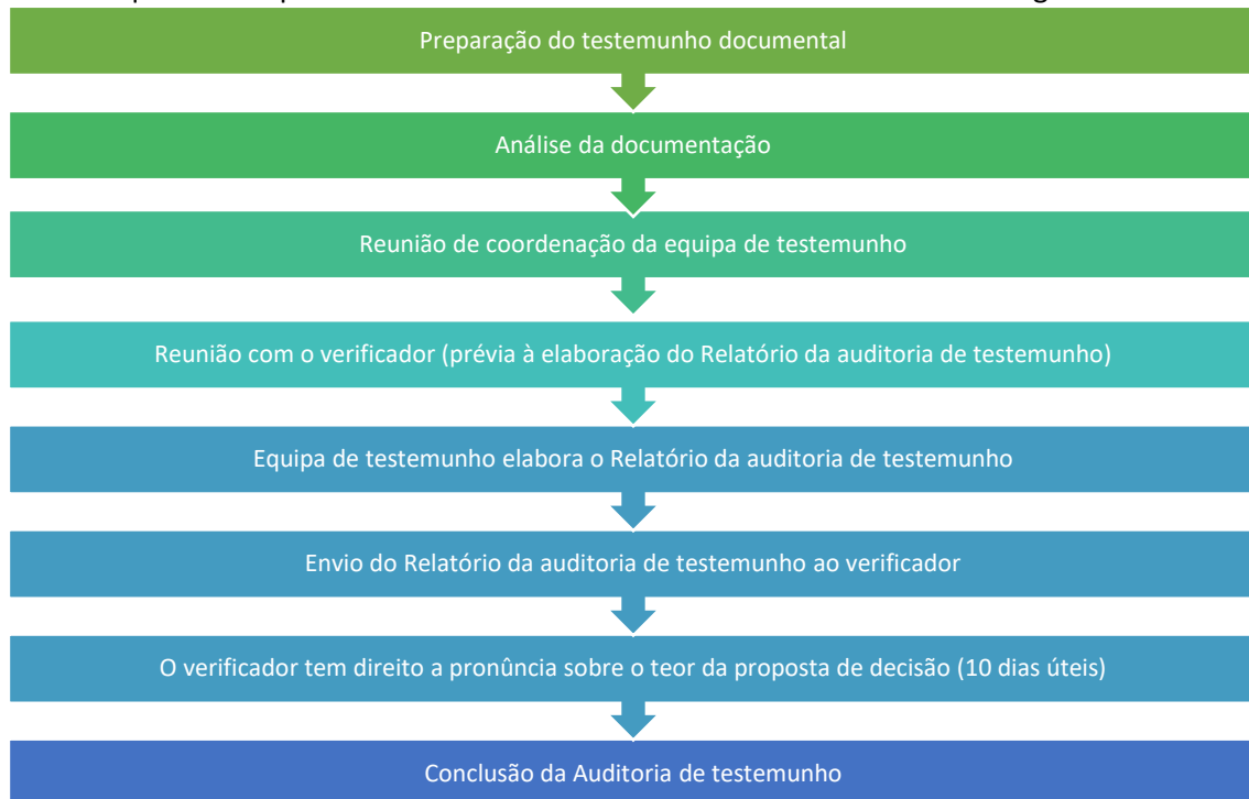
Figura 2 – Auditoria de testemunho documental

As fases que contemplam uma auditoria de testemunho documental são as seguintes: