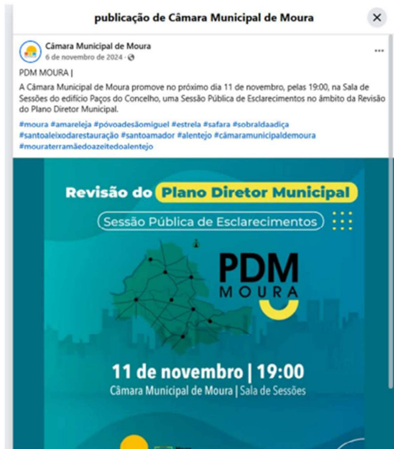
Figura 3.2. Cartaz de divulgação da sessão pública de apresentação da proposta de revisão do PDM