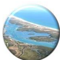
Ribeiras do Algarve