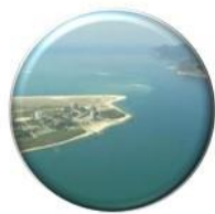
Sado e Mira