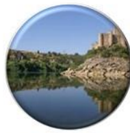
Tejo e Ribeiras do Oeste