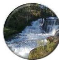
Cávado, Ave e Leça