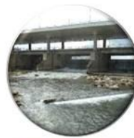
Vouga, Mondego e Lis

Parte 1 | Enquadramento e Aspetos Gerais