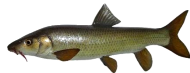
Barbo-comum ( Luciobarbus bocagei ) Comprimento máximo: 60 cm