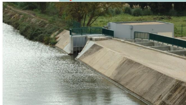
SÁIDA DA PASSAGEM PARA PEIXES