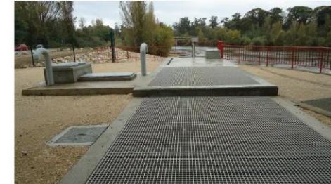
PASSAGEM PARA PEIXES - TROÇO DE JUSANTE E TOPO DA ESTRUTURA DO CAUDAL ADICIONAL