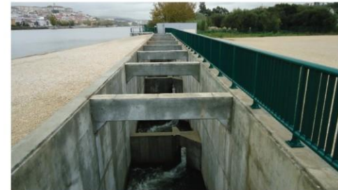
PASSAGEM PARA PEIXES - TROÇO DE MONTANTE