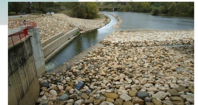
ENTRADA DA PASSAGEM PARA PEIXES A JUSANTE