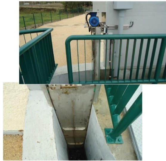
MOTOR E COMPORTA DE MONTANTE