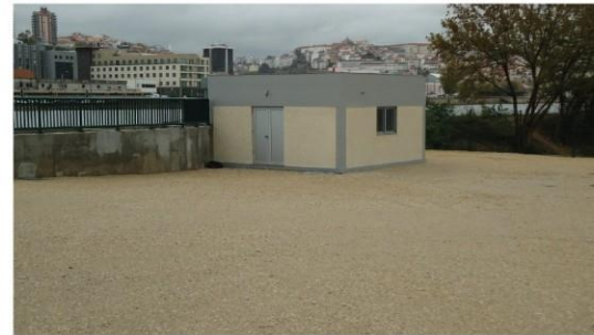
EDIFÍCIO DE MONITORIZAÇÃO