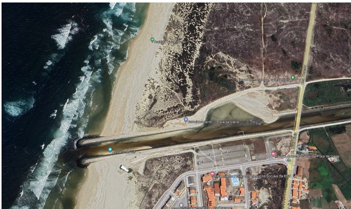
Figura 1 – Local da Intervenção

A intervenção localiza-se na Foz do Rio Lis, na Praia da Vieira, no Concelho da Marinha Grande e Distrito de Leiria (Figura 1).