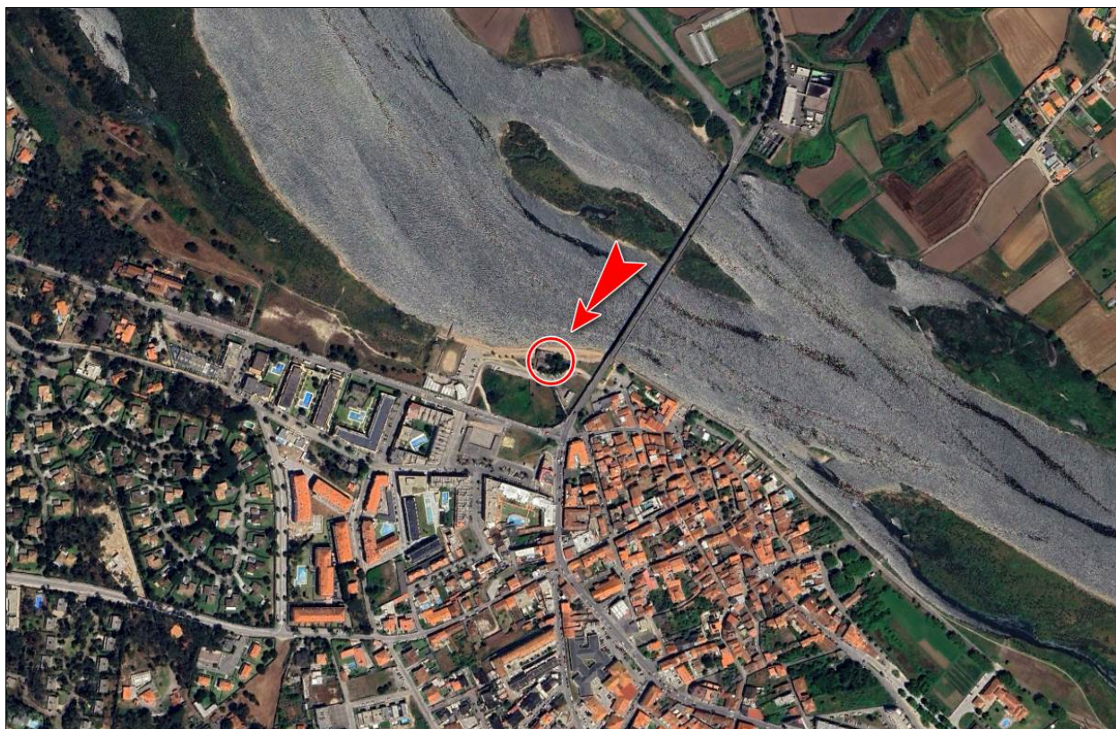
Fig. 2 – Fotografia aérea com a localização do Bar do Fojo (Fonte: Google Earth)