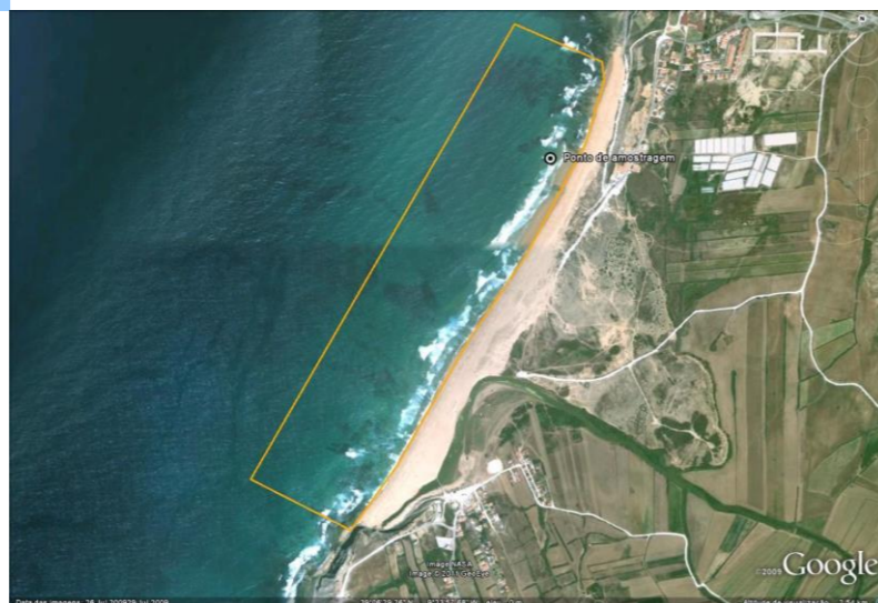
Figura 1 - Água balnear e ponto de amostragem (LAT 39.11436°, LONG -9.39379°, ETRS89) Figure 1 - Bathing water and sampling point (LAT 39.11436°, LONG -9.39379°, ETRS89)

Concelho: Torres Vedras Código Água Balnear: PTCD2P Bacia Hidrográfica: Ribeiras do Oeste Massa de água: CWB-II-4 ÉPOCA BALNEAR 2021: 12 Junho a 12 Setembro Frequência de amostragem: Cada 3 semanas