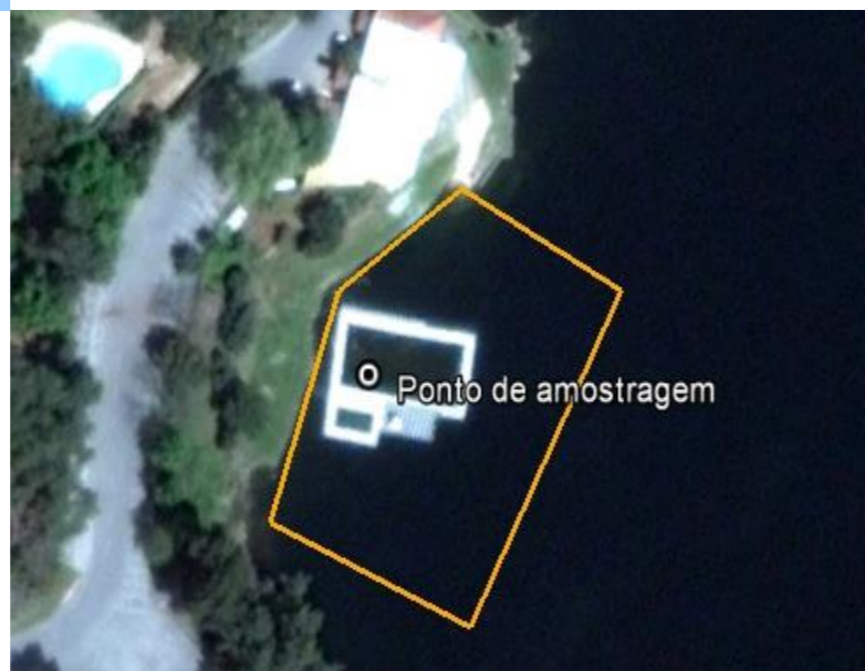
Figura 1 - Água balnear e ponto de amostragem (LAT 39.922407°, LONG -8.133082°, ETRS89) Figure 1 - Bathing water and sampling point (LAT 39.922407°, LONG -8.133082°, ETRS89)

Concelho: Pedrogão Grande Código Água Balnear: PTCE2U Bacia Hidrográfica: Bacia Hidrográfica do Rio Tejo Massa de água: Albufeira Cabril ÉPOCA BALNEAR 2021: 1 Junho a 15 Setembro Frequência de amostragem: Quinzenal