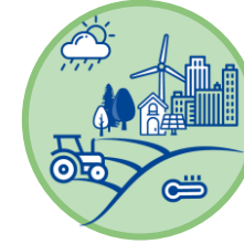
Mitigação e Adaptação às Alterações Climáticas