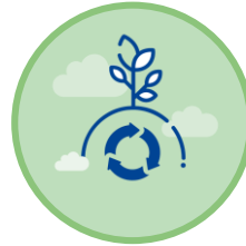
Economia Circular e Qualidade de Vida