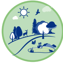
Natureza e Biodiversidade