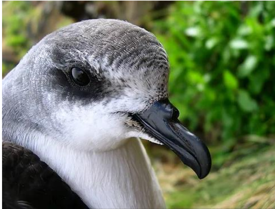
Freira-da-madeira, Pterodroma madeira Endémica 65-80 casais reprodutores