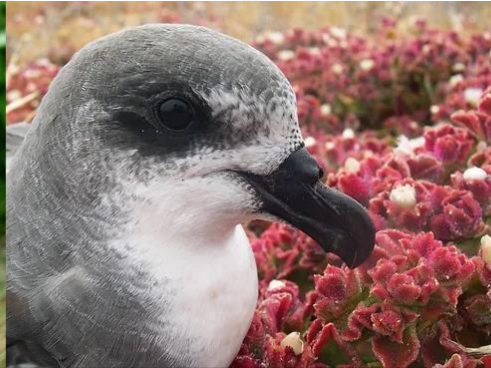
Freira-do-bugio, Pterodroma deserta Endémica 160-180 casais reprodutores