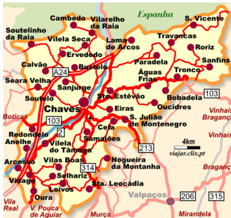
Figura nº 2 - Representação da área de estudo, a nível de freguesias e rede viária