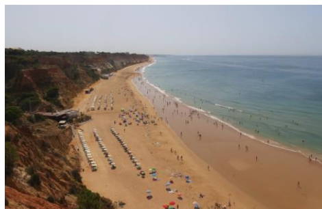
14 de julho de 2017