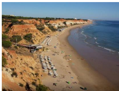
28 de setembro de 2016