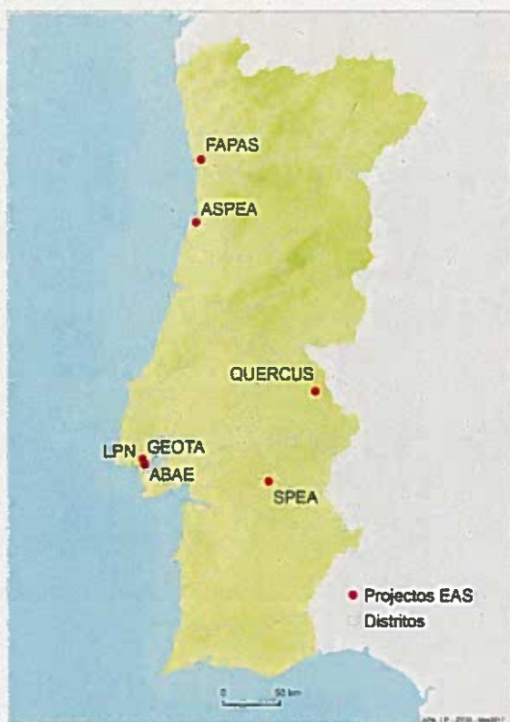
Fig:1 localização da sede central das ONGA

Em 2016-17 a rede de docentes em mobilidade foi composta por sete docentes alocados em sete ONGA inscritas no RNOE - Registo Nacional de ONGA e Equiparadas - 1 .(Figura 1)