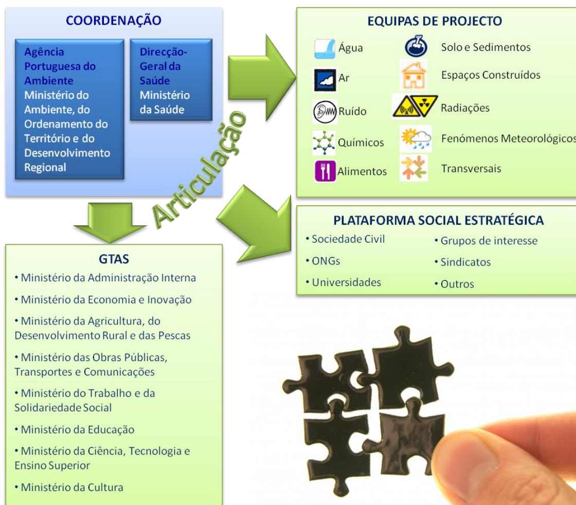
Figura 2 – Articulação entre as várias unidades orgânicas criadas no âmbito do PNAAS

A operacionalização de um Plano desta natureza requer uma estrutura organizacional flexível e dinâmica que permita a rentabilização de esforços e recursos, desenvolvendo e reforçando parcerias. Por outro lado, exige mecanismos que possibilitem a mobilização da sociedade portuguesa, dos diferentes parceiros sociais e, individualmente de cada cidadão, para as Acções do PNAAS. Neste sentido, adoptou-se por uma estrutura que engloba diferentes unidades orgânicas (as Entidades Coordenadoras, o Grupo de Trabalho interministerial Ambiente e Saúde (GTAS), as Equipas de Projecto (EP) e a Plataforma Social Estratégica (PSE)) com atribuições distintas e complementares (Figura 2 e Quadro 2).