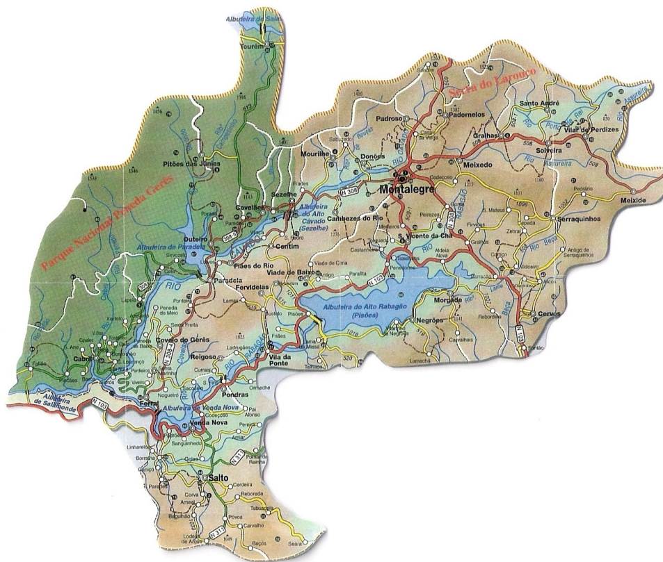
Figura nº 2 - Representação da área de estudo, a nível de freguesias e rede viária