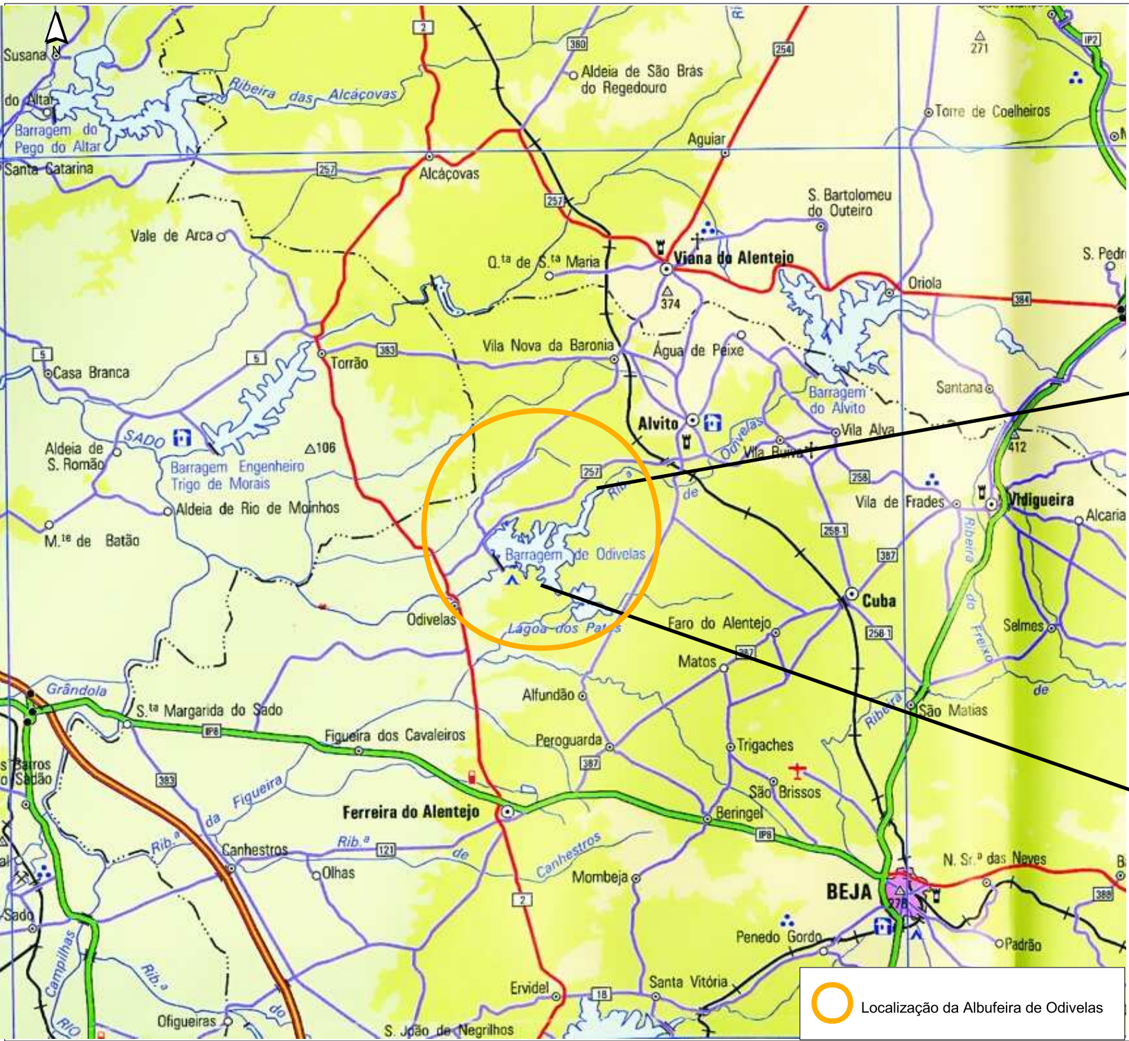
Extracto da Carta Militar Itinerária 2002, à escala 1:600.000 do Instituto Geográfico do Exército.