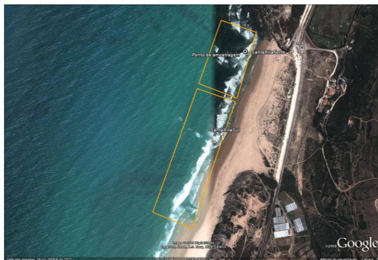
Figura 1 - Água balnear e ponto de amostragem (LAT 39.174491º, LONG -9.358557º, ETRS89)