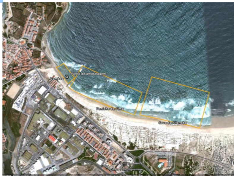
Figura 1 - Água balnear e ponto de amostragem (LAT 39.36100º, LON -9.362633º, ETRS89) Figure 1 - Bathing water and sampling point (LAT 39.36100º, LONG -9.362633º, ETRS89)