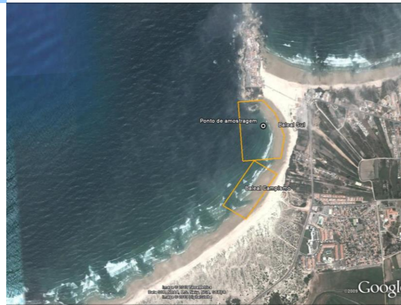
Figura 1 - Água balnear e ponto de amostragem (LAT 39.367521º, LON -9.340124º, ETRS89) Figure 1 - Bathing water and sampling point (LAT 39.367521º, LONG -9.340124º, ETRS89)

De acordo com o nº6 do Artº7º do D.L. 135/2009, republicado pelo D.L.113/2012, as águas balneares de Baleal Campismo e Baleal Sul foram agrupadas, (PTCV7PG) sendo Baleal Sul o ponto de amostragem representativo do agrupamento.