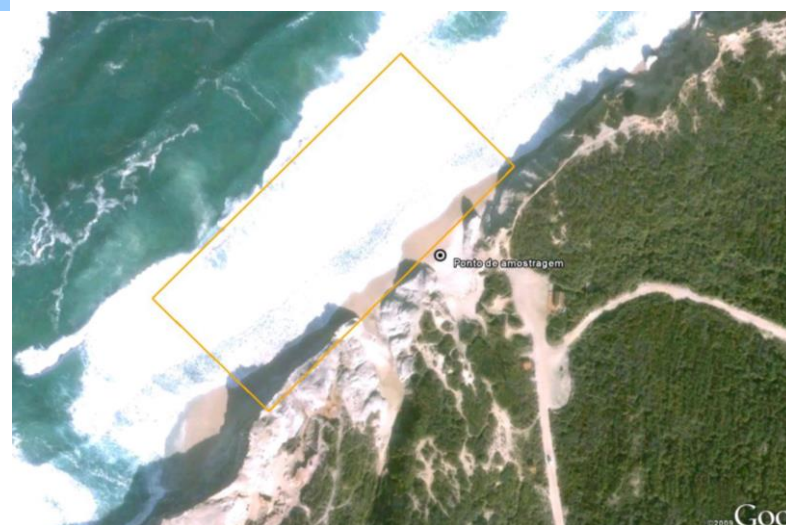
Figura 1 - Água balnear e ponto de amostragem (LAT 39.4207°, LONG -9.24705°, ETRS89) Figure 1 - Bathing water and sampling point (LAT 39.4207°, LONG -9.24705°, ETRS89)

Concelho: Óbidos Código Água Balnear: PTCV8M Bacia Hidrográfica: Ribeiras do Oeste Massa de água: CWB-II-3 ÉPOCA BALNEAR 2021: 30 Junho a 15 Setembro Frequência de amostragem: Quinzenal