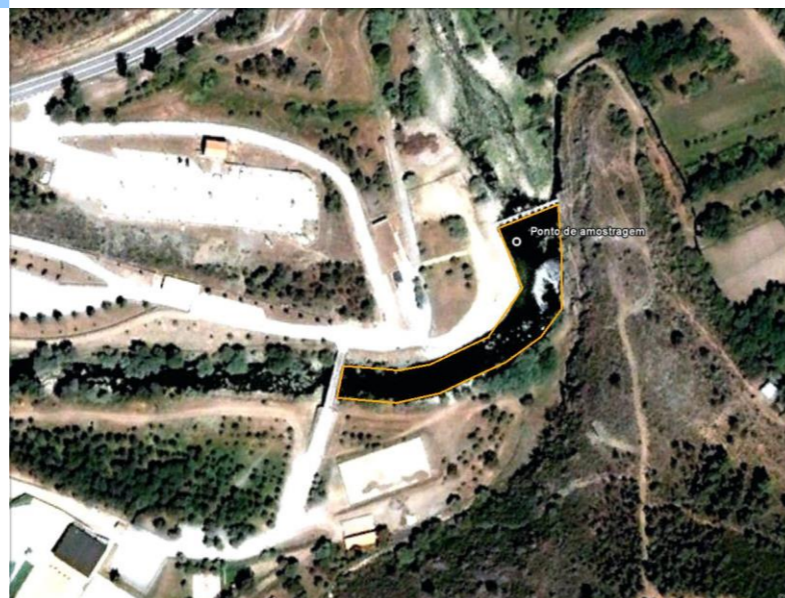
Figura 1 - Água balnear e ponto de amostragem (LAT 40.411997º, LONG -7.46718º, ETRS89) Figure 1 - Bathing water and sampling point (LAT 40.411997º, LONG -7.46718º, ETRS89)

Concelho: Manteigas Código Água Balnear: PTCV2Q Bacia Hidrográfica: Bacia Hidrográfica do Rio Tejo Massa de água: Rio Zêzere ÉPOCA BALNEAR 2021: 1 Julho a 31 Agosto Frequência de amostragem: Quinzenal