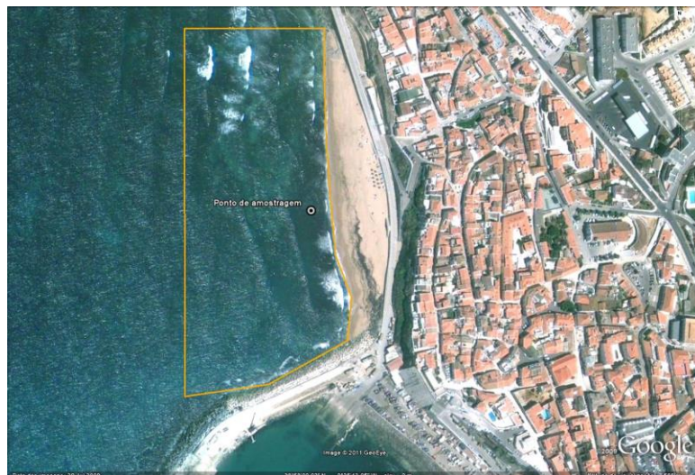
Figura 1 - Água balnear e ponto de amostragem (LAT 38,97°, LONG -9,42°, ETRS89) Figure 1 - Bathing water and sampling point (LAT38,97 °, LONG -9,42°, ETRS89)

ÉPOCA BALNEAR 2021: 12 Junho a 12 Setembro Frequência de amostragem: Cada 3 semanas