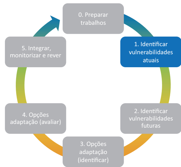
Figura 1. Esquema conceptual representativo da base metodológica ADAM, utilizada para o desenvolvimento das EMAAC no âmbito do projeto ClimAdaPT.Local

A sua utilização está programada de modo a acompanhar a evolução gradual das etapas do projeto, bem como apoiar as diferentes equipas locais que intervirão, em cada uma das autarquias participantes, no trabalho de desenvolvimento das estratégias municipais.