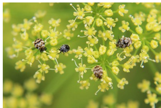
‘Little lives’ by Maria Rodriguez

Foi com grande satisfação que, nesta apresentação, vimos a Alemanha destacar o trabalho de Portugal nesta matéria, referindo-se às metas de adaptação constantes do Programa de Ação para a Adaptação às Alterações Climáticas (P-3AC).